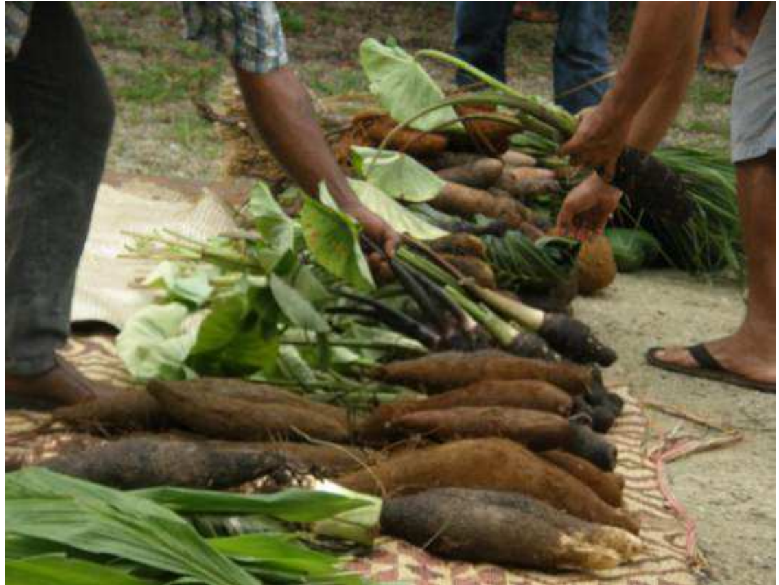
Fête de l'Igname 2011 au Centre Culturel Tjibaou