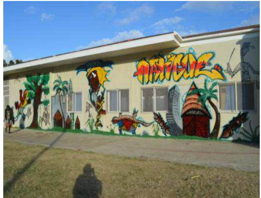
Maison Municipale de Quartier d'Artiques